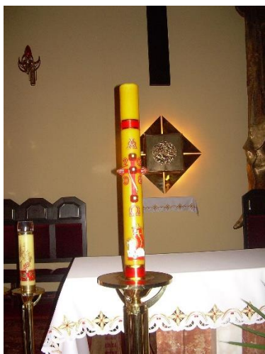
Ilustracja 1: Świeca

Figura zmartwychwstałego Jezusa – Pan Jezus trzyma w ręku zwycięską czerwoną chorągiew. Oznacza to, że jest On Królem, który pokonał śmierć.