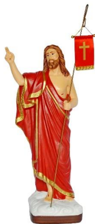
Ilustracja 2: Figurka Jezusa trzymającego w ręku chorągiewkę

W Wielkim Poście, gdy w naszych kościołach panował smutny nastrój, nie śpiewaliśmy „Alleluja”.